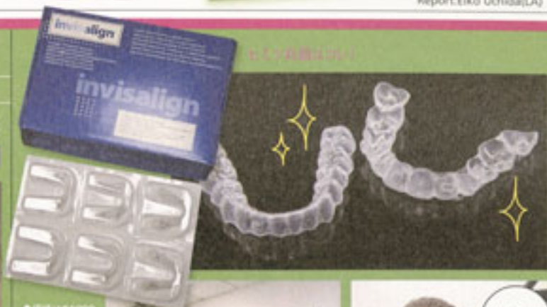
もって帰る歯はこれ!