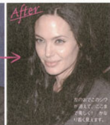
アンジェリーナ・ジョリー